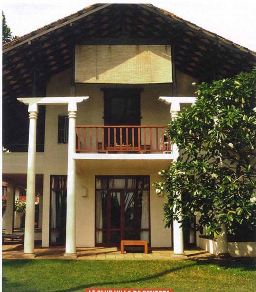
LE CLUB VILLA DE BENTOTA

→ Construit par Bawa à la demande d'un ami, cet hôtel de charme est typique de l'évolution du style de Bawa, incorporant de plus en plus d'éléments traditionnels locaux à une architecture moderniste dont piliers et pilotis sont des éléments emblématiques.