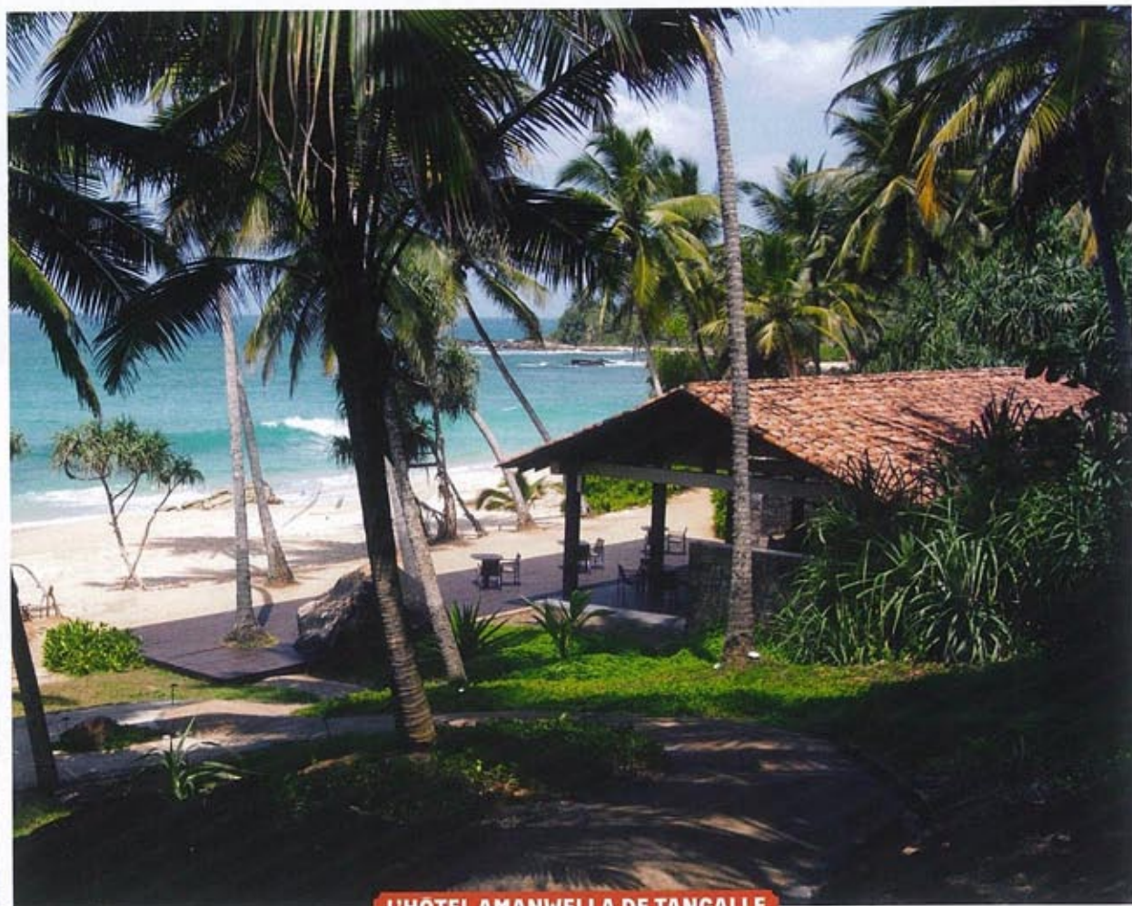
L'HOTEL AMANWELLA DE TANGALLE

Bien qu'ayant souffert du tsunami qui fit des milliers de morts en 2004, la ville de Galle a conservé ses principaux monuments, dont son fort, son église et The Light House, construit par Bawa en 1995. Difficile, à la vue de cet établissement, de ne pas penser au couvent de la Tourette de Le Corbusier, qui déclara en 1933 au Congrès d'Athènes: « Les matériaux de l'urbanisme sont le soleil, l'espace, les arbres, l'acier et le ciment armé, dans cet ordre et dans cette hiérarchie. » >>