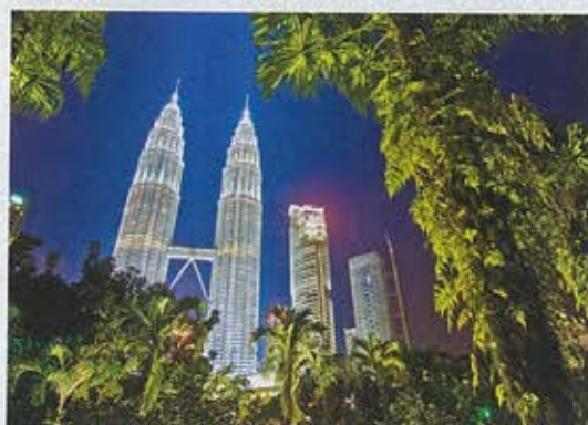
Les tours jumelles Petronas, à Kuala Lumpur. Ce double gratte-ciel fut, à son inauguration en 1998, le plus haut du monde.

Des luxueuses tours Petronas (452 m) aux quartiers populaires peranakan (anciens migrants sino-malais) ou de Little India, Kuala Lumpur est le symbole de la puissance économique du pays. Capitale par excellence, elle est aussi riche d'une mixité de cultures qui la rend très attachante. Malgré son développement exponentiel, « KL », comme la nomment les Malaisiens, qui fut bâtie sur un estuaire boueux où on découvrit de l'or, conserve en son cœur un trésor : 10 hectares de forêt primaire, celle-là même qui il y a cinq siècles recouvrait le pays. Le soir, sa masse sombre contraste avec les twin towers Petronas illuminées. Au sein du jardin botanique, une stupéfiante serre aux papillons abrite des spécimens géants, parmi lesquels le Rajah Brooke, aux ailes noir et vert fluo, emblème de la Malaisie.