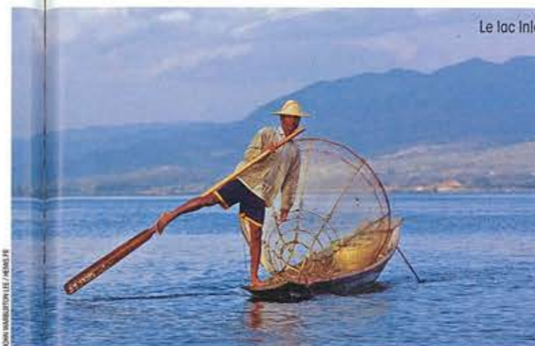
Le lac Inle.