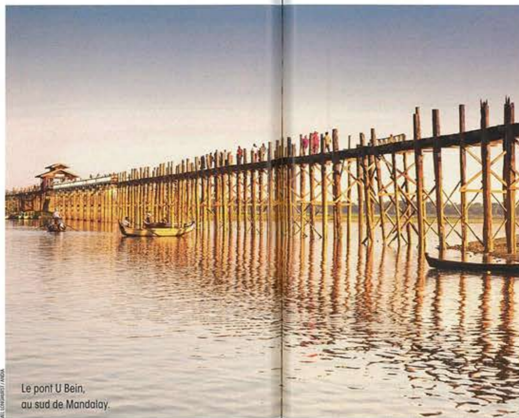
Le pont U Bein, au sud de Mandalay.

Bagan est une féerie de pierre. Imaginez une forêt de stupas (monuments bouddhistes), dressant leurs hampes sur fond de paysage montagneux. Dans un méandre du fleuve Ayeyarwady (ex-Irrawaddy), au sud de Mandalay, cette cité fondée en 849 fut la capitale du premier royaume birman. Dans son Livre des merveilles (1298), Marco Polo en parle comme « l'un des plus beaux spectacles du monde ». Au temps de sa splendeur, Bagan aurait compté jusqu'à 13 000 temples et monastères. Il en reste plus de 2 000. Vidée manu militari de ses derniers habitants en 1998, Bagan a résisté aux tremblements de terre – le dernier fin août – et aux reconstructions hâtives et malencontreuses décidées par la junte militaire. Si vous deviez vous contenter de la visite d'un seul temple, choisissez celui d'Ananda (XI e siècle), avec sa tour-sanctuaire fuselée dite en « épi de maïs » qui culmine à 55 m. Ananda est un pur chef-d'œuvre que défendent ses chinthes (lions) de pierre. Mais il faut aussi savoir se perdre sur les pistes sablonneuses de Bagan pour éprouver la délicieuse illusion d'être seuls au monde, au pied d'un temple apparemment oublié de tous.