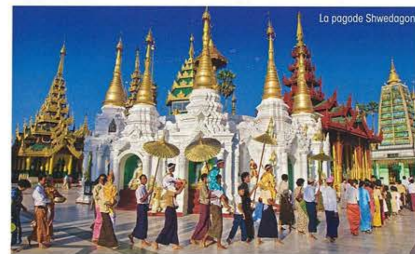
La pagode Shwedagon.

RIEN NE DÉPASSE EN ÉMOTION LA VISION DE LA PAGODE SHWEDAGON, CAPARAÇONNÉE D'OR, QUI RENFERMERAIT HUIT CHEVEUX DE BOUDDHA.