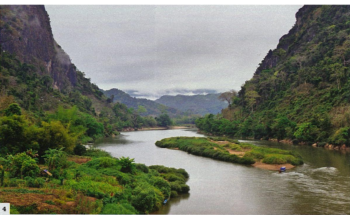
4. A Nong Khiaw, halte agréable entre Luang Prabang et les villages du Nord, la rivière Nam Ou a formé des gorges luxuriantes. 5. Dans l'enceinte du palais royal de Luang Prabang, la pagode Vat Ho Pha Bang où est exposée une précieuse statue de bouddha en or (ou Pha Bang).